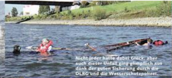
Nicht jeder hatte dabei Glück, aber auch dieser Unfall ging glimpflich aus dank der guten Sicherung durch die DLRG und die Wasserschutzpolizei.