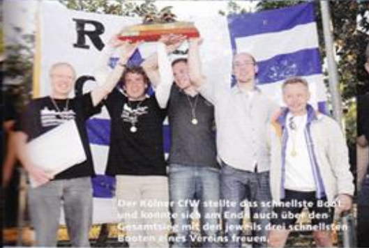
Der Kölner CFW stellte das schnellste Boot und konnte sich am Ende auch über den Gesamtsieg mit drei jeweils drei schnellsten Booten eines Vereins freuen.