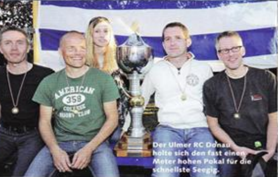
Der Ulmer RC Dnau holte sich den fast einen Meter hohen Pokal für die schnellste Seegig.

Ein wundervoll sonnigen Herbsttag erlebten 700 Ruderer (143 Boote) beim 39. Rheinmarathon am 9. Oktober 2010 vom Wasser aus. Gesamtschnellstes Boot war der Kölner Club für Wassersport in 2:08,09 Stunden.