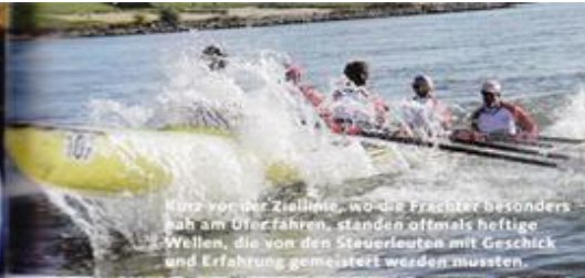
Vor der Ziellinie, wo die Frachter besonders nah am Überfahren, standen oftmals heftige Wellen, die von den Steuerleuten mit Geschick und Erfahrung gemeistert werden mussten.

...gespannt davor, gebannt dabei, gebräunt, ermüdet und mit Rheinwasser im Boot im Ziel, erfreut beim Bier